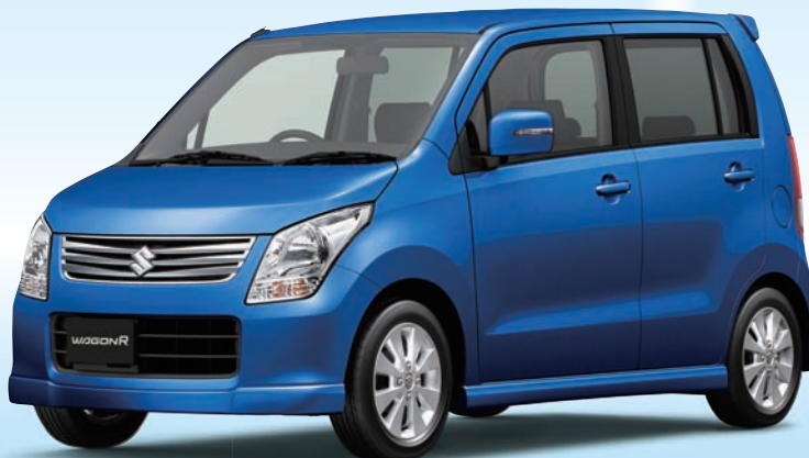
※仕上がりイメージ