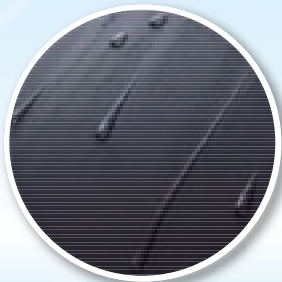
ガラス系撥水タイプ

水をはじく、汚れを防ぐ、抜群の耐久性のボディコート! 手間をかけずに、ピカピカの光沢感が長期間持続します。